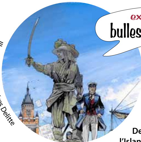
Illustration : Jean-Yves Delitte

Neuf dessinateurs éclectiques réunis pour une exposition sans précédent sur la mer dans le dessin et, en particulier, dans la bande dessinée.